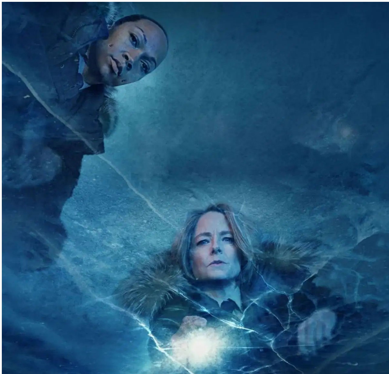
Les enquêtrices Evangeline Navarro (Kali Reis) et Liz Danvers (Jodie Foster).

Le quatrième acte, sur Prime Video, prend l'exact contre-pied de la mythique première saison, masculine et caniculaire, avec un duo d'enquêtrices intranquilles cherchant la vérité dans les glaces de l'Alaska.